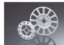
EJOT lėkštelės VT 90 ir SBL 140 plus

Su EJOT H4 eco siūlome naudoti šias papildomas detales: